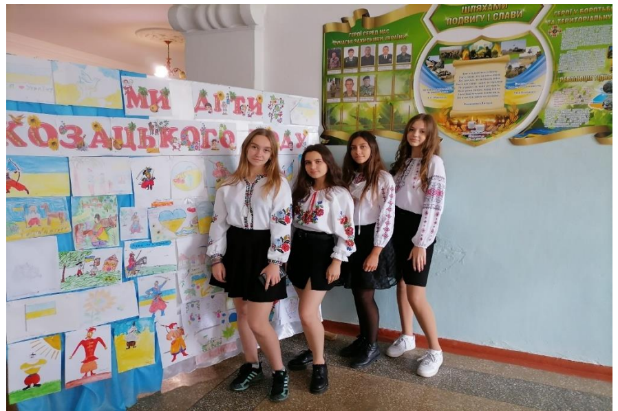
День Збройних Сил України, майстер клас для дітей «Розпис новорічної іграшки», Свято Миколая.